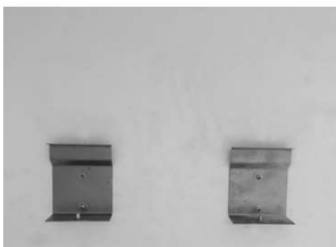
1 - Fixar os sustentadores na parede.

Para a instalação tipo “parede”, o equipamento deve ser instalado de forma que fique firmemente preso, conforme mostram as figuras abaixo.