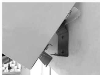
2 - Encaixe o equipamento no sustentador.