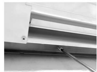
3 - Trave o suporte com os Parafusos.

Para fixação utilize, sempre que possível buchas para fixação ou buchas especiais para blocos vazados, para garantir a instalação.